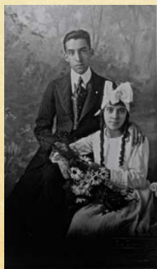
Foto Pareja y joven

sello circular en la esquina inferior derecha dice en el sello en relieve repujado ...